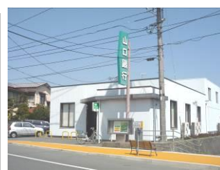
山口銀行田部支店 ・・・徒歩約7~8分