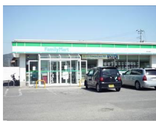
ファミリーマート (下関菊川田部店) ・・・徒歩約5~6分