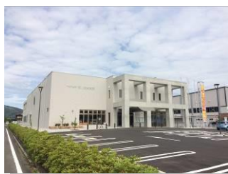
下関市役所 菊川総合支所 ・・・徒歩約20分