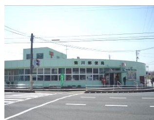
菊川郵便局 ・・・徒歩約15分