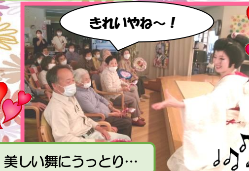
美しい舞にうっとり...