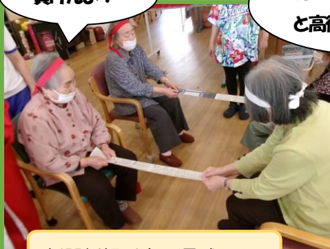
新聞紙綱引きで運試し!