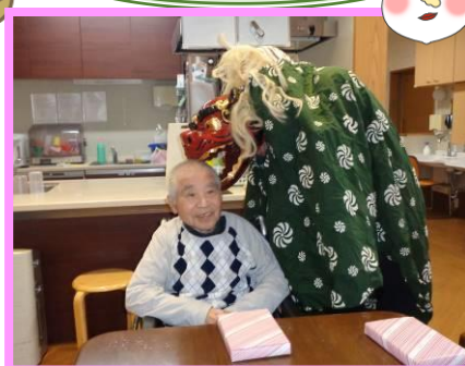
獅子に頭を噛んでもらいました。福笑いをされ初笑いもあり、良いお正月になりました。