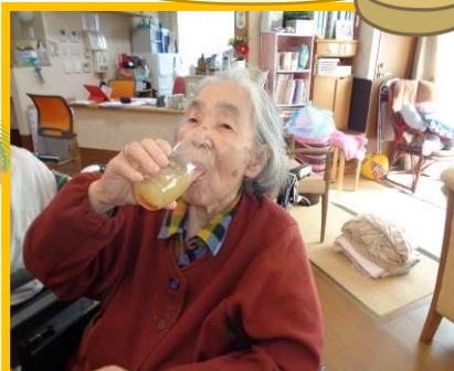
ノンアルコールビールやジュースで乾杯し、寄せ鍋をいただきました。