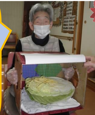
“中身はなんだろう” ゲーム