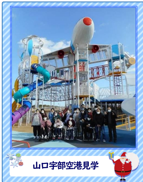
山口宇部空港見学