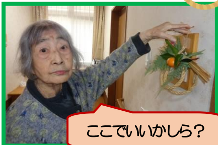
ここでいいかしら？