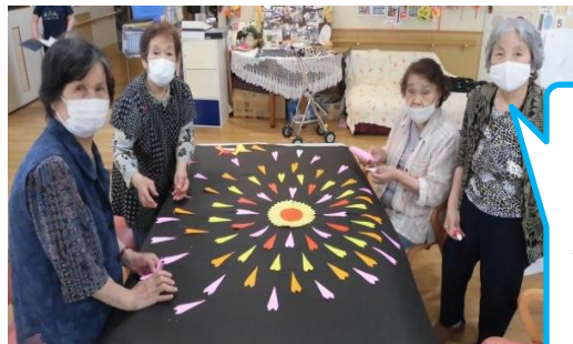
大きな花火を作るよ!