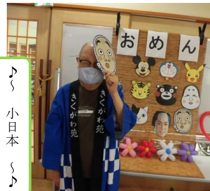
♪ 小日本 ♪