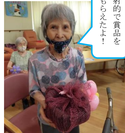
射的で賞品を もらえたよ!