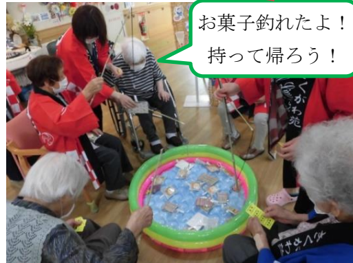
お菓子釣れたよ! 持って帰ろう!