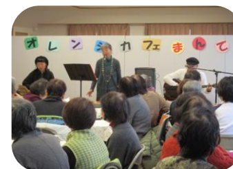
(オレンジカフェ開催支援)

主任介護支援専門員・ 社会福祉士・保健師 といった介護・福祉・ 保健・医療の専門 スタッフが対応します。