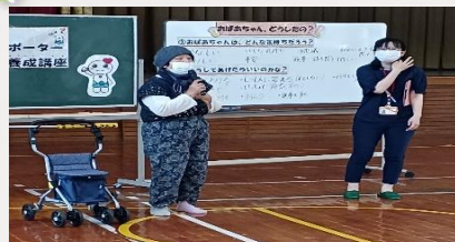
(認知症サポーター養成講座)