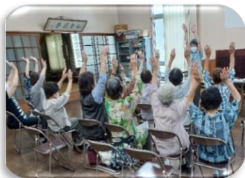
(介護予防ふれあい講座)