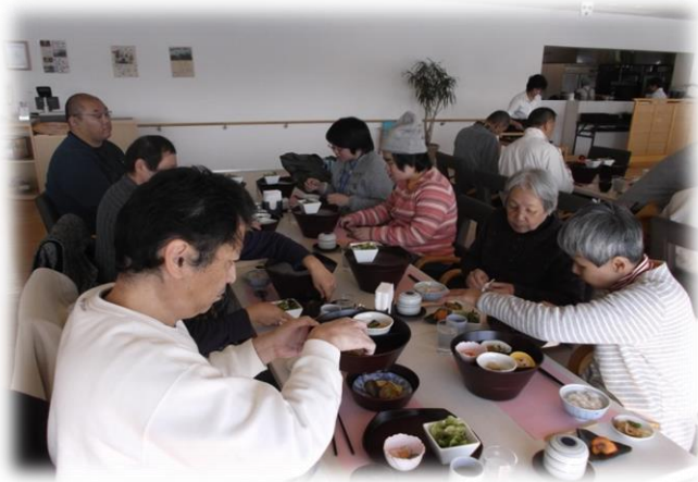
家族会の昼食は 満珠荘でいただきました。