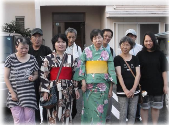
菊川町の夏祭りに参加される 皆さまで、記念撮影。